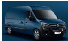
RNG BLÅ VOLGA