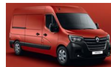
719 RØD MAGMA