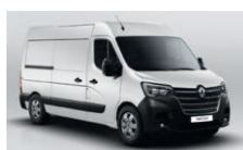
QNG MINERAL HVID