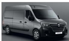
KPW URBAN GRÅ