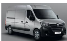
KNH GRÅ ETOILE