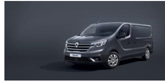
COMET GRÅ Ej H2