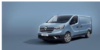
CUMULUS BLÅ Ej H2