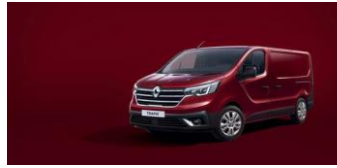
CARMIN RØD Ej H2