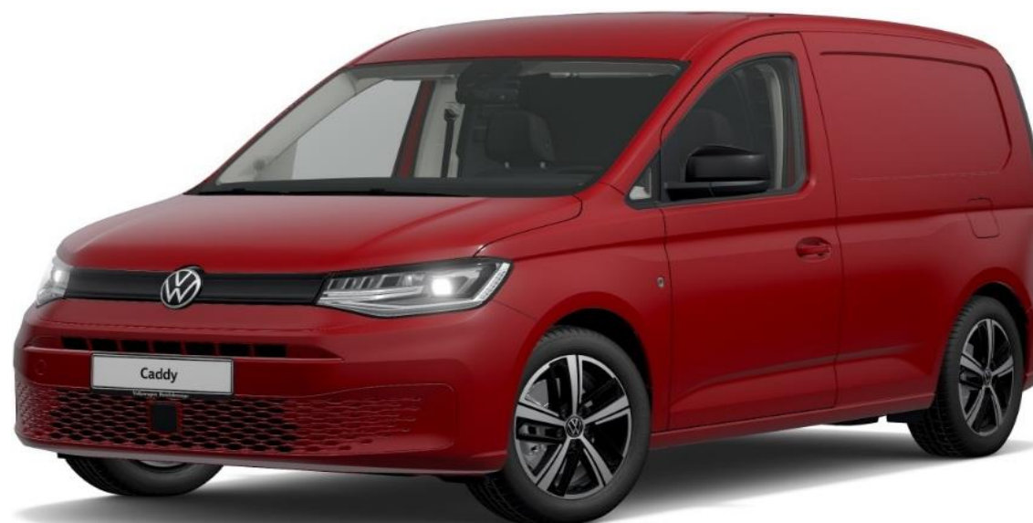
Cherry Red (4B4B) Unilak