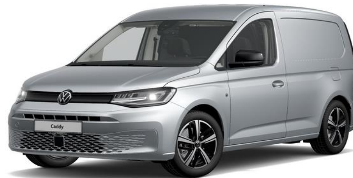
Reflex Silver (8E8E) Metallak