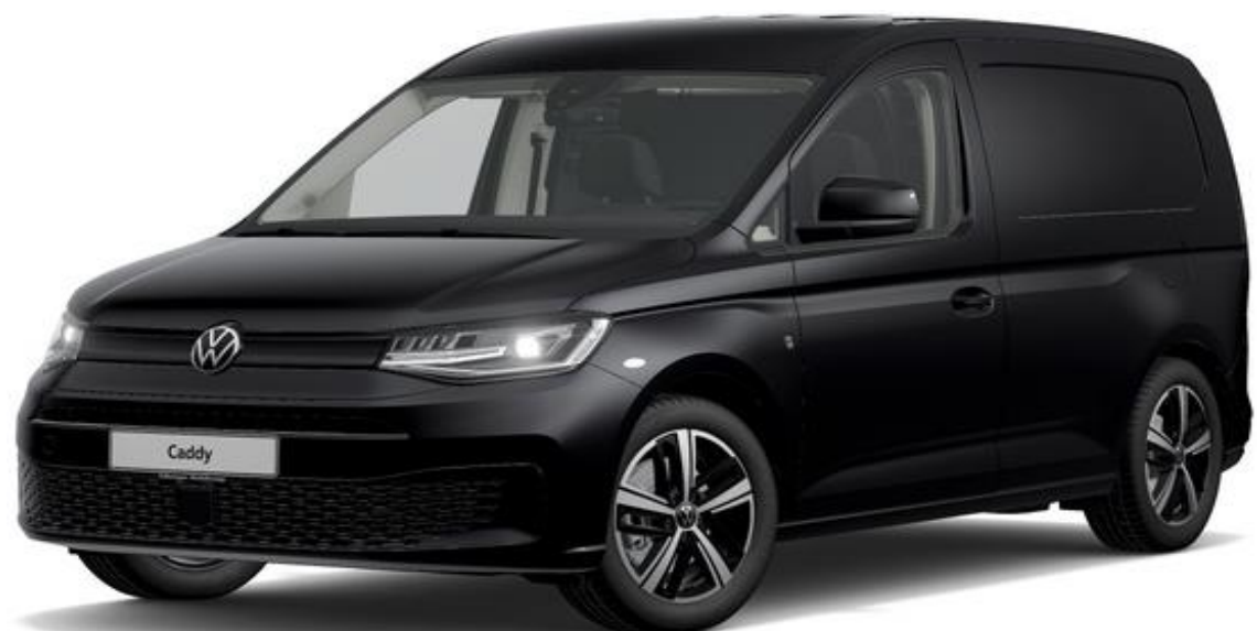
Deep Black (2T2T) Perleeffekt