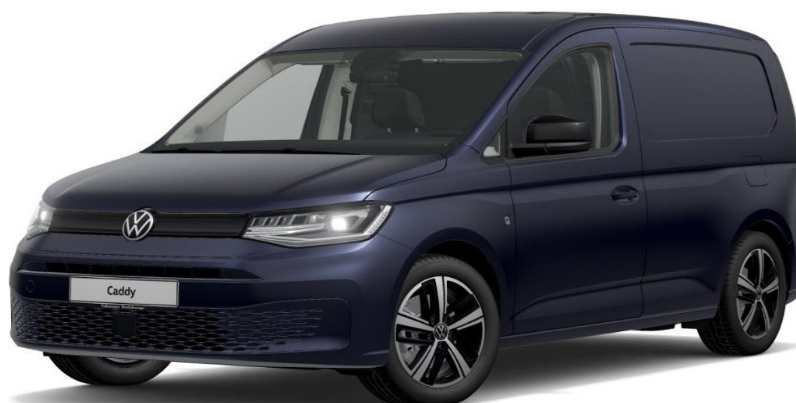
Starlight Blue (3S3S) Metallak