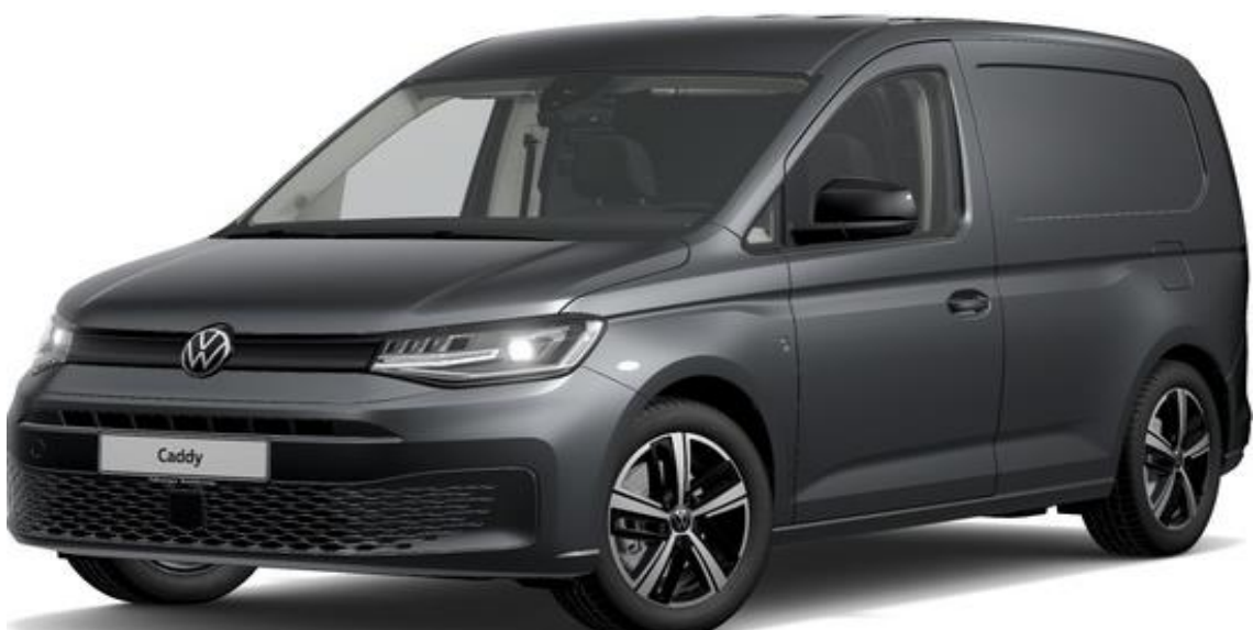
Indium Grey (X3X3) Metallak