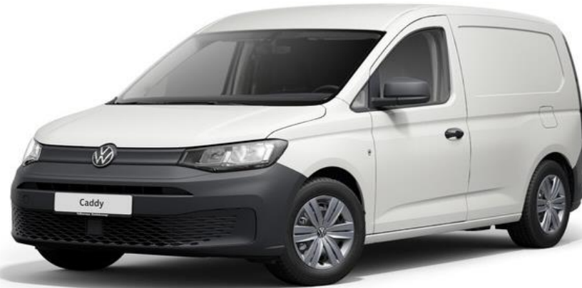
Comfort Udover basis udstyr