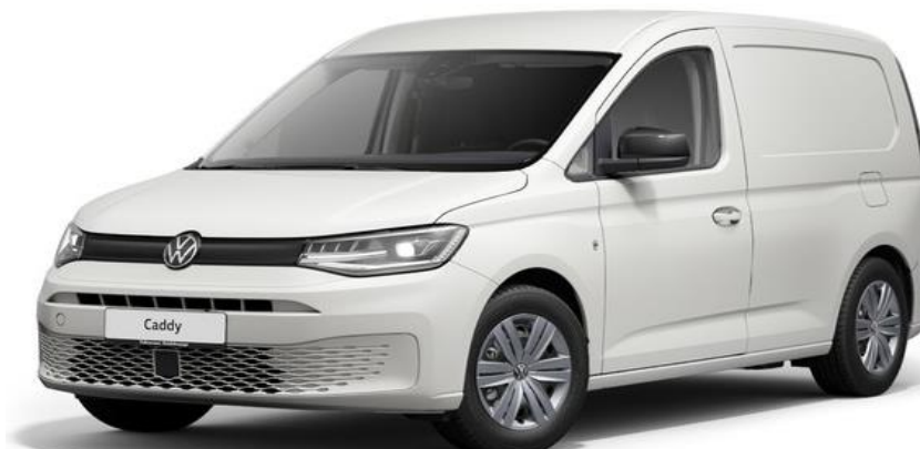
Pro Udover Comfort udstyr