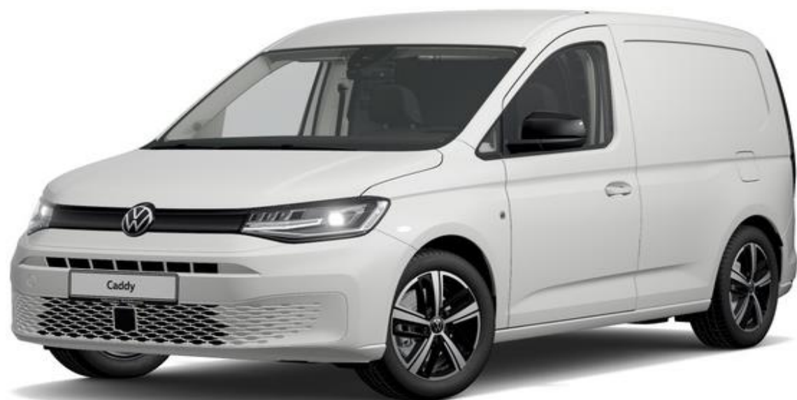
Candy White (B4B4) Standard lak

Nedenstående farver er de mest populære. Se flere farver hos din lokale Volkswagen forhandler. Bilerne er vist med ekstraudstyr.